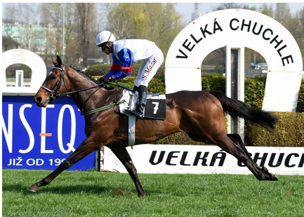
Palazzo Corsini při vítězném debutu