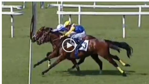
Shaywan těsně poráží Trip To Rhodose

prohození pořadí není ve výroku ani čárka. Aktuálně je v něm uvedeno pouze to, že Trip To Rhodos zvítězil o hlavu. Pro zachování důvěry v čistotu dostihů je přitom právě jasné vysvětlení podobných sporných situací zásadní.